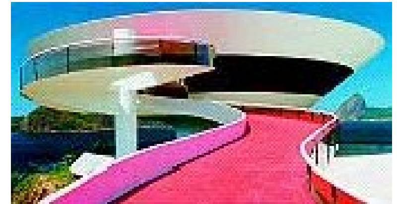
1993 – MUSEU DE ARTE CONTEMPORÃNEA NITERÓI