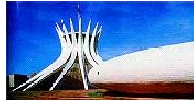
1959 – CATEDRAL DE BRASÍLIA