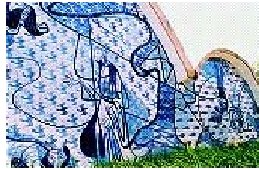
1940 – IGREJA PAMPULHA