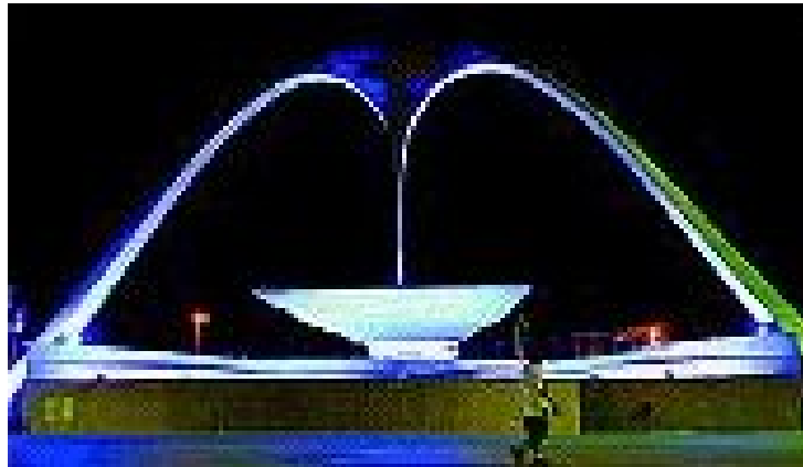
1982 – SAMBÓDROMO – RIO DE JANEIRO